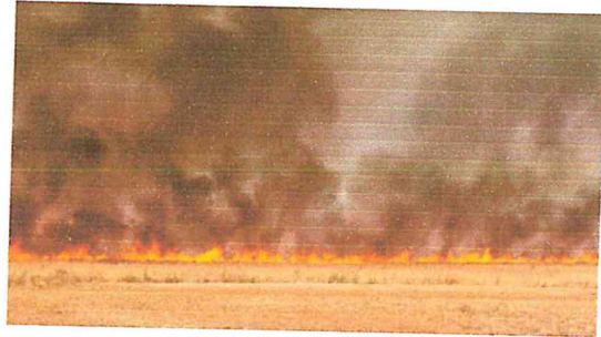
IMG 2- Foco de incêndio no PARNAEMAS JUL 2021