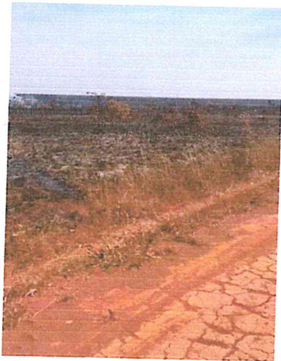
IMG 3- Zona de Amortecimento PARNAEMAS.