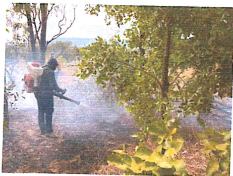
IMG - 5 - Combate foco, margem de estrada.