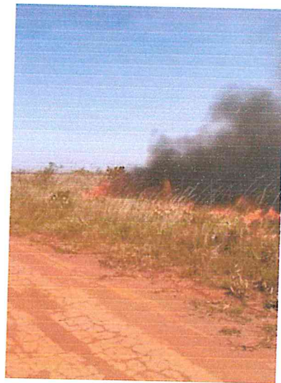
IMG 4- Zona de Amortecimento PARNAEMAS.